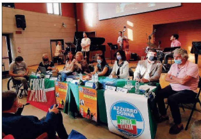
Applausi ed emozione per l'incontro con la deputata e atleta paralimpica Giusy Versace, ospite a Rovigo di Azzurro Donna