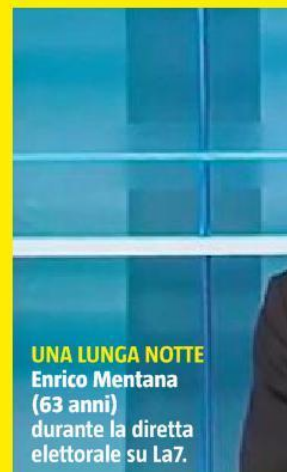
UNA LUNGA NOTTE Enrico Mentana (63 anni) durante la diretta elettorale su La7.

«L'adrenalina è un fattore fondamentale: ci sono tal-