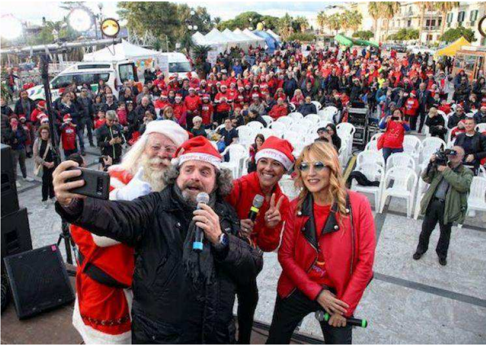
Foto Happy Run for ChristMas