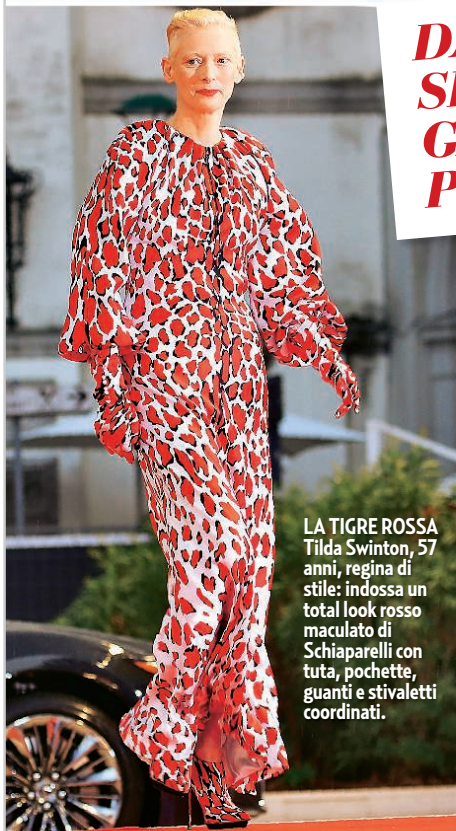
LA TIGRE ROSSA Tilda Swinton, 57 anni, regina di stile: indossa un total look rosso maculato di Schiaparelli con tuta, pochette, guanti e stivaletti coordinati.