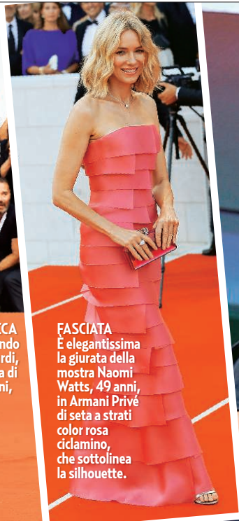
FASCIATA È elegantissima la giurata della mostra Naomi Watts, 49 anni, in Armani Privé di seta a strati color rosa ciclamino, che sottolinea la silhouette.