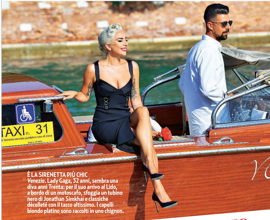
È LA SIRENETTA PIÙ CHIC Venezia. Lady Gaga, 32 anni, sembra una diva anni Trenta: per il suo arrivo al Lido, a bordo di un motoscafo, sfoggia un tubino nero di Jonathan Simkhai e classiche décolleté con il tacco altissimo. I capelli biondo platino sono raccolti in uno chignon.