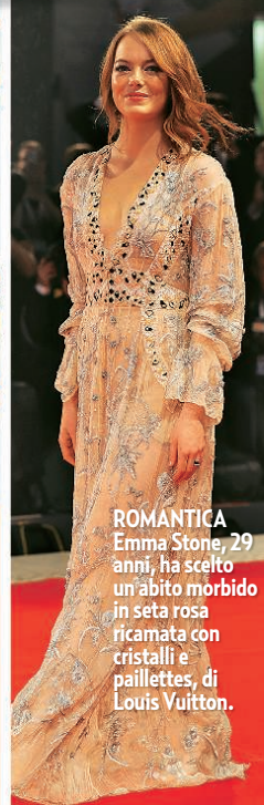
ROMANTICA Emma Stone, 29 anni, ha scelto un abito morbido in seta rosa ricamata con cristalli e paillettes, di Louis Vuitton.